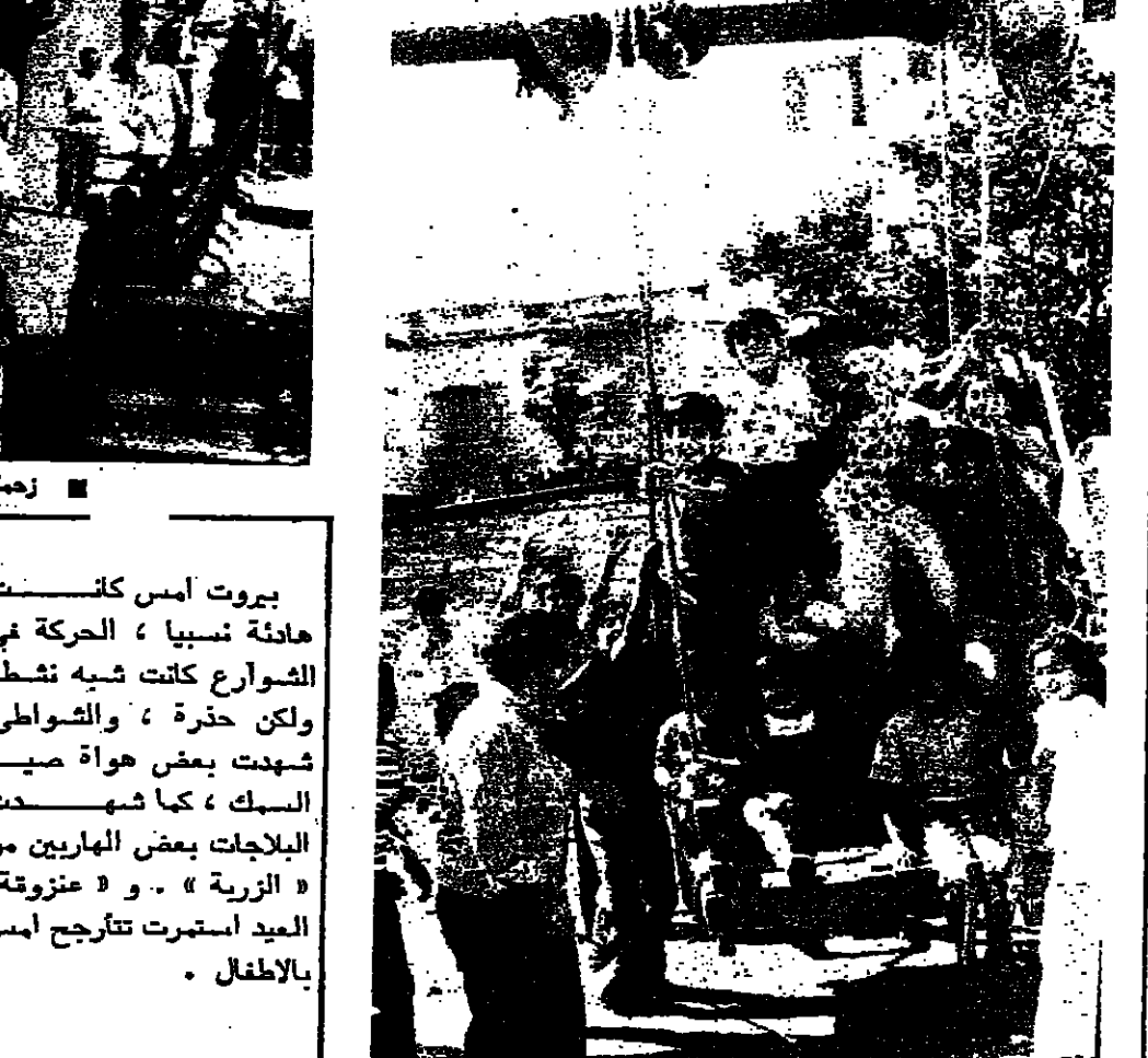
اولاد يتراحمون على «عزوفة»